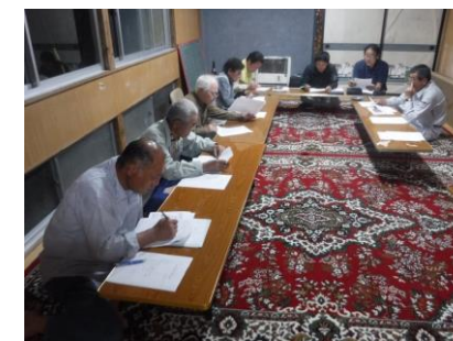
写真1 地区説明会の様子