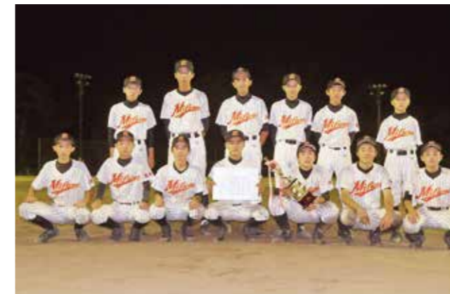
御船中学校野球部ナインたち