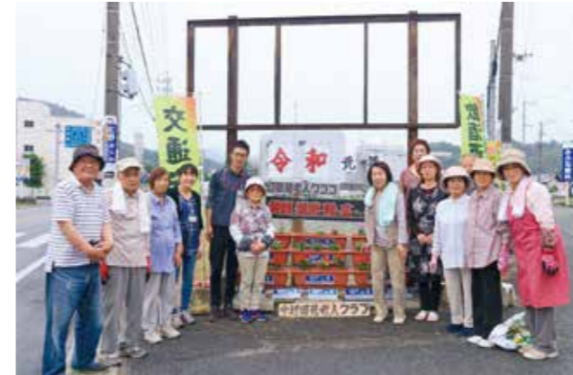
中辺田見老人クラブ、地域とともに