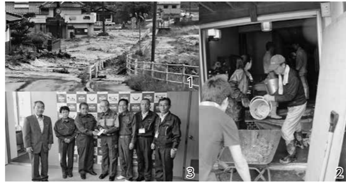
1_河川が氾濫し、住宅地に押し寄せている様子 2_家屋の中から土砂を撤去する様子 3_添田町に見舞金を手渡す御船町と町議会

8月から庁舎1階ロビーには、この被災に伴い募金箱を設置していました。皆さまからの温かいご支援、ありがとうございました。