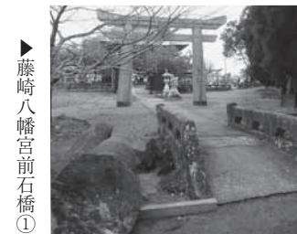
藤崎八幡宮前石橋①