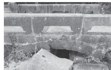
藤崎八幡宮前石橋②