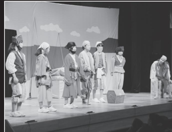
※写真は昨年の様子。