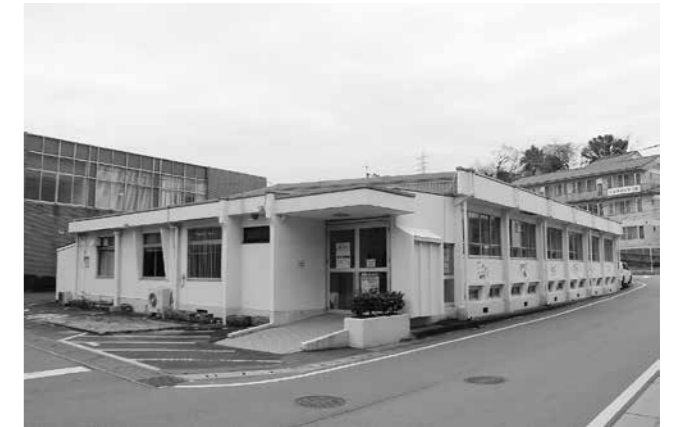
期日前投票所となる旧恐竜博物館

新 しい期日前投票所は町保健センター横の「旧恐竜博物館」になります。期日前投票を行う場合は、送られてきた入場券（入場券がない場合は、本人確認ができる書類）を持って、期日前投票所へお越しください。