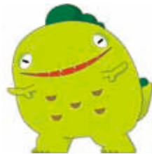
QRコード (ポータルサイト)

おすすめは、「恐竜」「水」「五人の先哲」「モデルコース」の 카테고리。御船町ならではの観光情報やグルメ情報などがエリアごとに見ることができます。