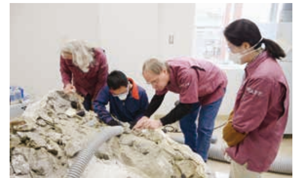
ロッキー博物館の専門家から指導を受ける職員

現在、標本作製室では、平成24年に姉妹館提携を結んだ、モンタナ州立大学附属ロッキー博物館から持ってきた、ダズプレトサウルス (ティラノサウルスの仲間) の化石のクリーニングが行われ、間近で見学することができます。