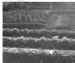
四季折々の野菜を栽培し、皆様の食事に提供されます。