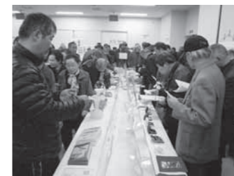
約200人が来場者した前回の公売会の様子(平成24年3月)

町税などの滞納者から差し押さえた財産を売却する公売会を開催します。今回、公売に出品するのは約150点。入札方式で実施し、液晶テレビや家具、家電、日用品、生活雑貨などが出品予定です(入札は100円から)。