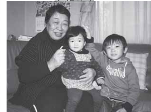
※「ムゾラシカ」は御船弁で「可愛い」の意味です。